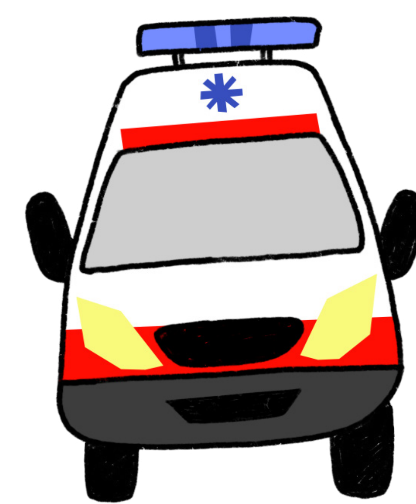
Vehículos de emergencia

Elegir el carril BUS-VAO es ahorrar tiempo, es evitar atascos.