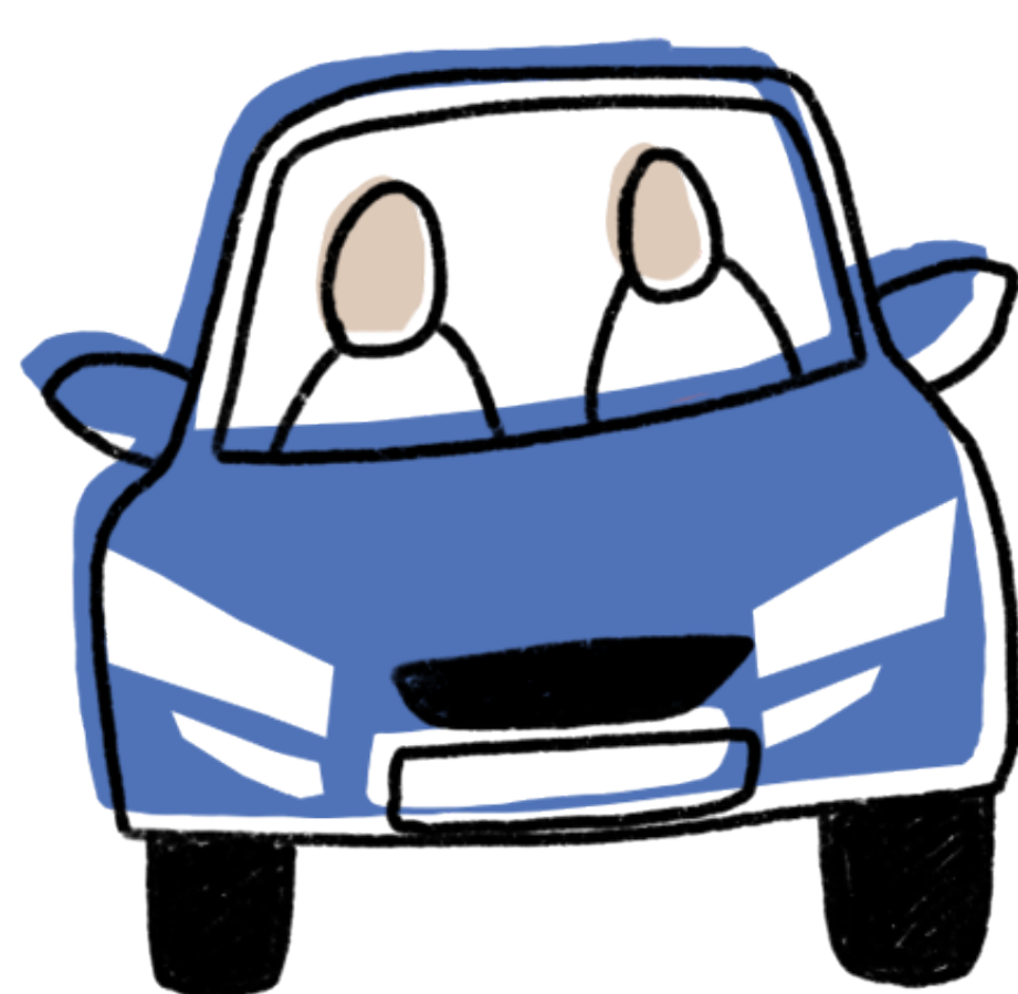
Vehículo con 2 o más ocupantes